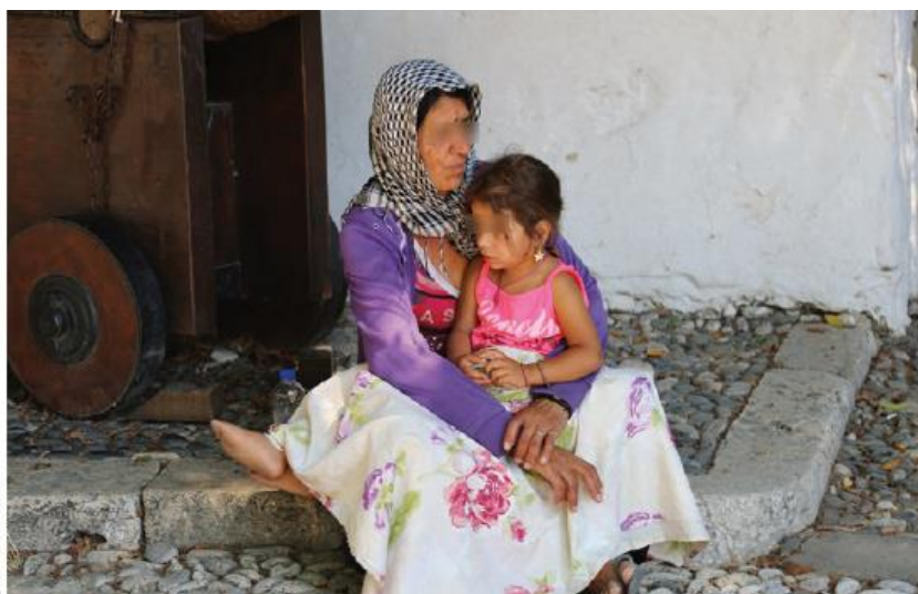
Zdjęcie 3 Dorosła migrantka z małaletnią, które utknęły na wyspie Kos