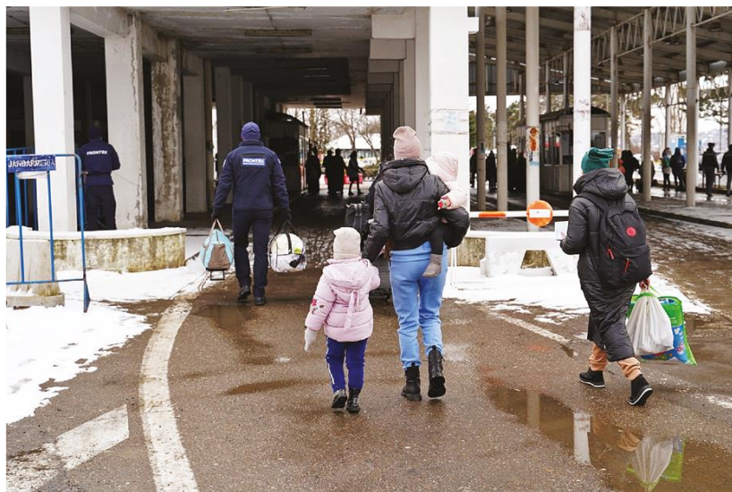
Zdjęcie 7 Pomoc udzielana przez Frontexu i państw członkowskich uchodźcom z Ukrainy