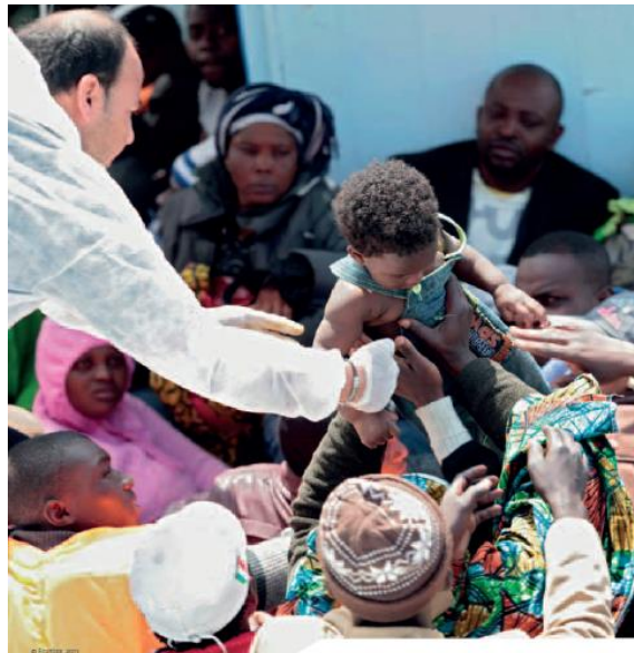
Zdjęcie 1 Przyjęcie i pomoc migrantom