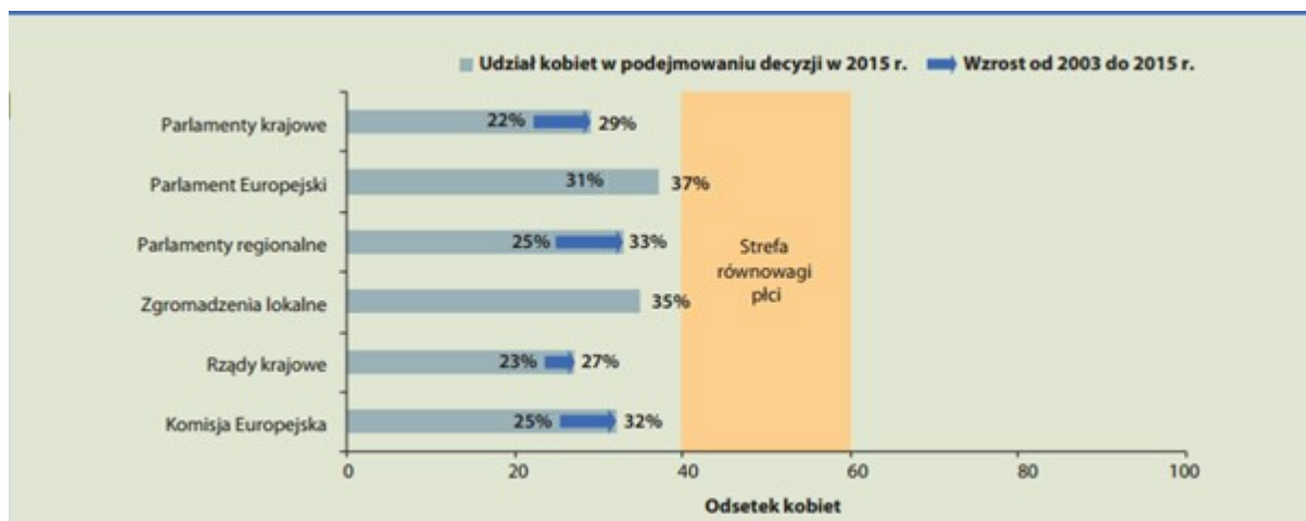
Wykres 1. Postępy w osiągnięciu równowagi płci we władzy politycznej w UE-28, lata 2003-2015

Źródło: Równouprawnienie płci w podejmowaniu decyzji politycznych , Europejski Instytut ds. równości kobiet i mężczyzn, za: http://eige.europa.eu/sites/default/files/documents/2016.1523_mh0116064pln_pdfweb_20170511095722.pdf (30.10.2018).