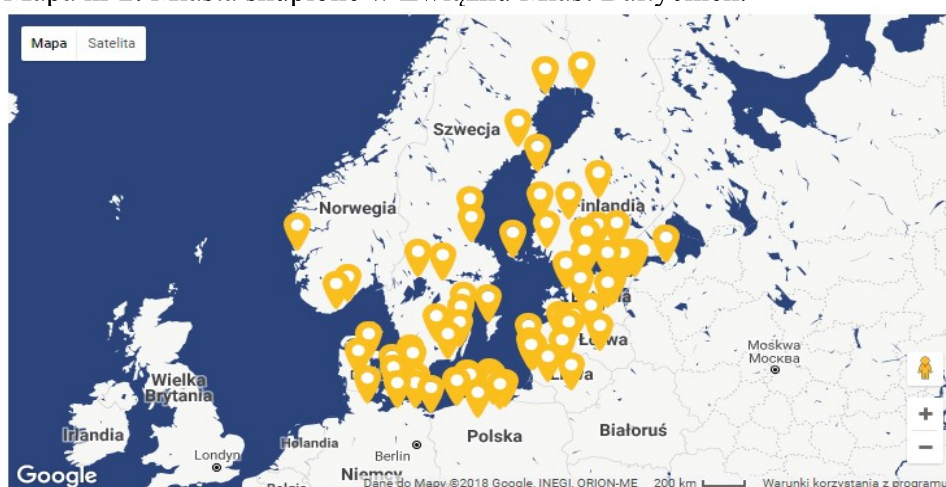
Mapa nr 2. Miasta skupione w Związku Miast Bałtyckich.

Mapę miast skupionych w UBC przedstawia mapa nr 2.